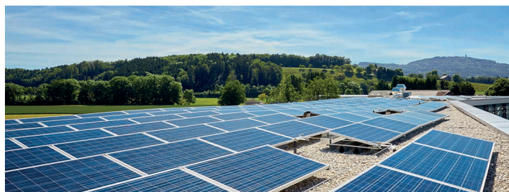
Une entreprise à Forel a valorisé sa toiture en posant 660 m 2 de panneaux solaires photovoltaïques.