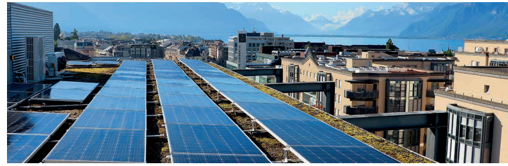
Les panneaux solaires posés sur le toit du bâtiment de Holdinova, à Vevey, produisent 40'000 kWh pour une autoconsommation à 100 %.

Vous consommez l'énergie produite selon vos besoins. Le surplus est quant à lui réinjecté dans le réseau électrique.